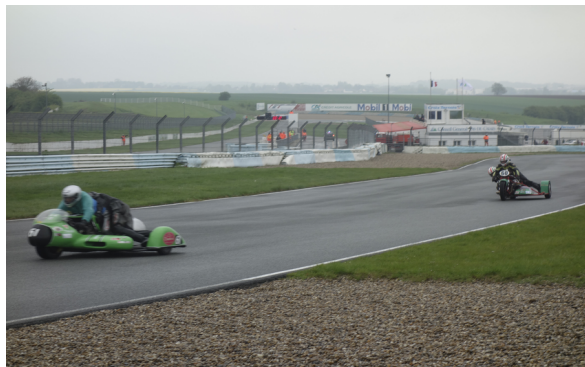
A la poursuite d'un 900 Kawasaki