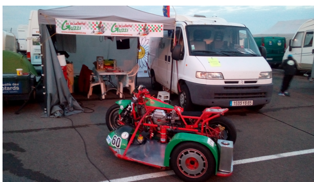
Le stand P'tit bolide