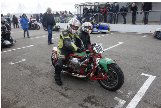
Attente en pré grille